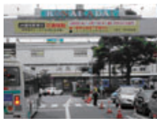
写真2 既存駅前広場空間活用のための交通社会実験（千葉市）