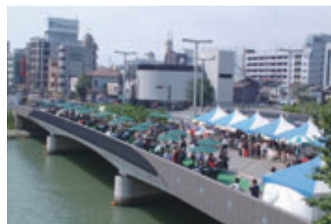
勝山橋オープンカフェ・・・川面で風を感じて