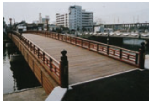
長崎街道の起点・常盤橋（木の橋） （森鷗外は馬で常盤橋を渡り、小倉城跡の陸軍司令部へ通った）