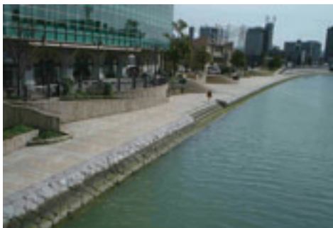
民間施設と一体になった親水空間

なお、この「紫川マイタウン・マイリバー整備地区」は、ハード事業、ソフト事業をうまく融合させ、賑わいのある魅力的なまちづくりが行われていることが評価され、平成19年度都市景観大賞「美しいまちなみ大賞」を受賞しました。