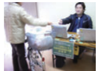
写真4 ITを活用した既存駐輪場活用実験（柏市）