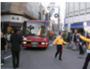
写真1 トランジットモール等社会実験（目黒区）

写真4：柏市をフィールドとして、IT活用やインセンティブ付与によって、活用度の低い既存の付置義務駐輪場に放置自転車を誘導する社会実験を行いました。他に、エコドライブ推進イベント（栃木県）や、情報提供にかかわる民間組織立ちあげの取組み（三郷市）などもあります。