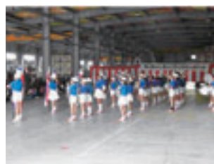
写真3 大規模計画地における地元組織強化イベント（上越市）