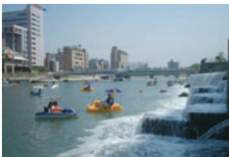
賑わいだけでなく、アユやシロウオも戻ってきた紫川（写真右側：人工の滝）