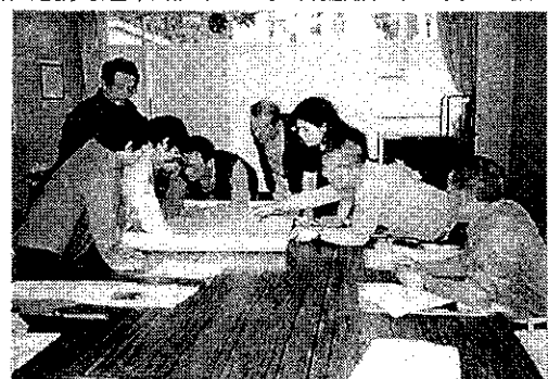
[ワークショップの風景]